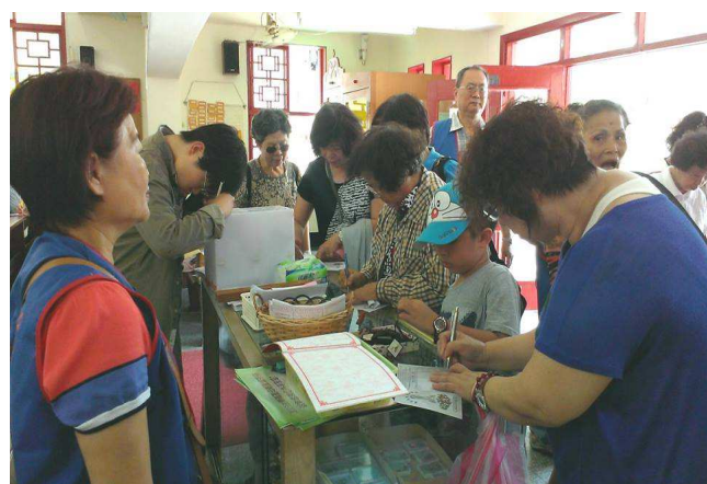
本堂志工歡迎高雄朝聖教友