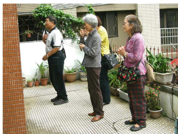
朝聖教友虔誠祈請聖母轉禱