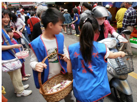
慶祝母親節小朋友們上街福傳