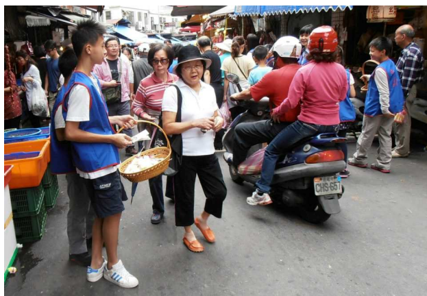
慶祝母親節小朋友們上街福傳